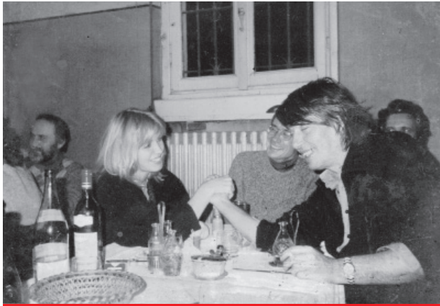
Dori Ghezzi e Fabrizio De André ad una cena di sottoscrizione per la rivista anarchica "A", nella Trattoria Della Torre, a Milano negli anni '80.

impegnati in maniera più politica, come giovani anarchici, in campagne contro le stragi di stato, per l'antifascismo militante, eccetera.